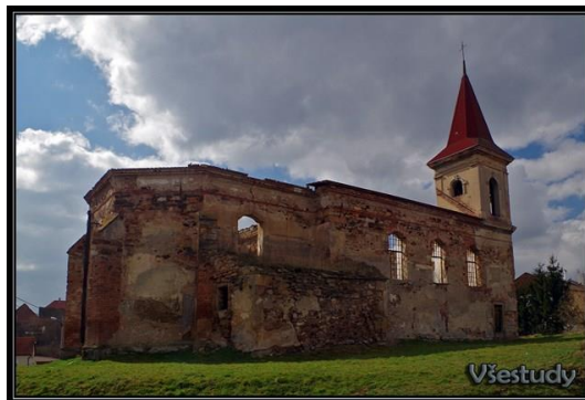
Kostel sv. Michaela Archanděl