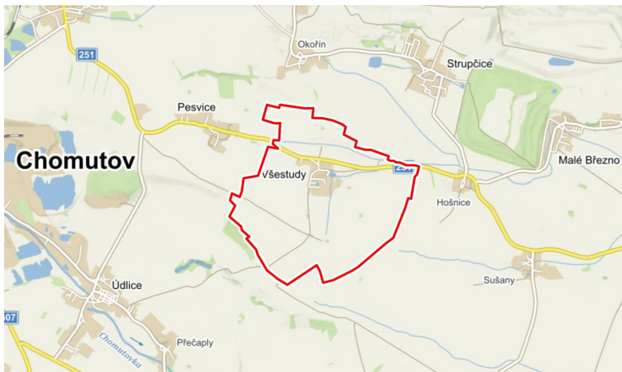
Mapa - Všestudy

Všestudy jsou obec se 190 obyvateli v Ústeckém kraji v okrese Chomutov. Nacházejí se asi 6,5 kilometru východně od statutárního města Chomutov, v nadmořské výšce okolo 335 metrů. Po většinu své historie byly součástí chomutovského a později červenohrádeckého panství a po zrušení poddanství se staly samostatnou obcí. Od devatenáctého století patřily k nejstarším místům hnědouhelného hornictví na Chomutovsku.