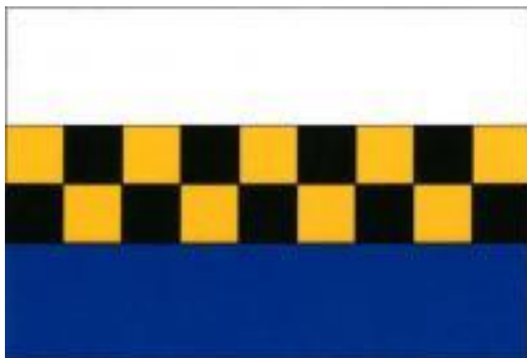
Vlajka obce Všestudy

Strategický plán rozvoje obce (SPRO) je dlouhodobým dokumentem naznačujícím záměry obce na období, které se neomezuje jen na jedno volební období zastupitelstva a je třeba jej neustále průběžně porovnávat se skutečností a aktualizovat. Při tvorbě a realizaci SPRO je nutné zachovávat rovnováhu mezi potřebami občanů, a tím, co je možné z hlediska omezených finančních zdrojů obce a z hlediska zachování stávajících přírodních a kulturní hodnot.